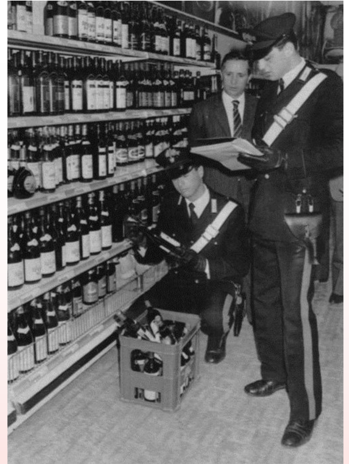
Roma, aprile 1986: Carabinieri del nucleo anti-soffisticazione controllano in un supermercato che le bottiglie in vendita non appartengano alle aziende sotto inchiesta